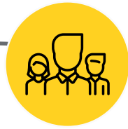
TIPPS & TRICKS B2C

Domschatzkammer Elisenbrunnen Rathaus Dom etc.